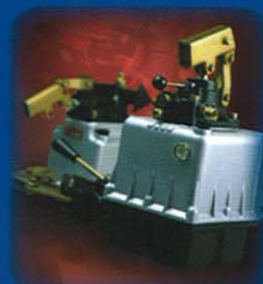
Pompe a mano