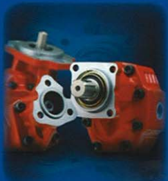
Pompe a ingranaggi