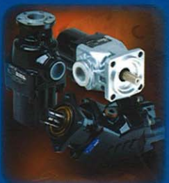
Pompe a pistoni