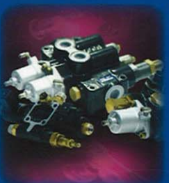
Valvole per ribaltabili