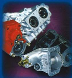
Prese di forza

Supplemento al n. 20 de "LA VOCE ECONOMICA DI BRESCIA"