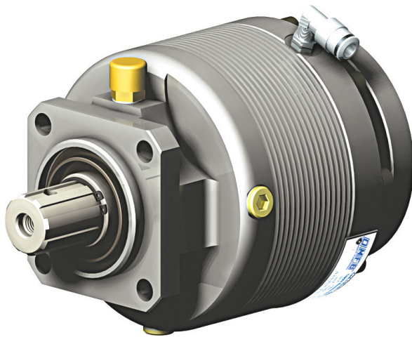
Ingresso ISO ISO input